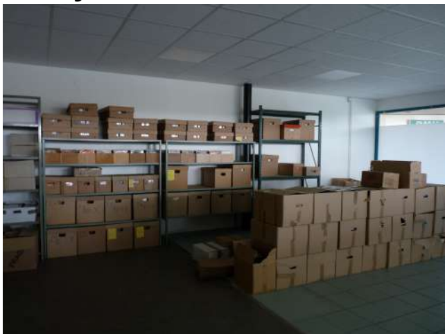
Les 33 tours inventoriés sur les étagères