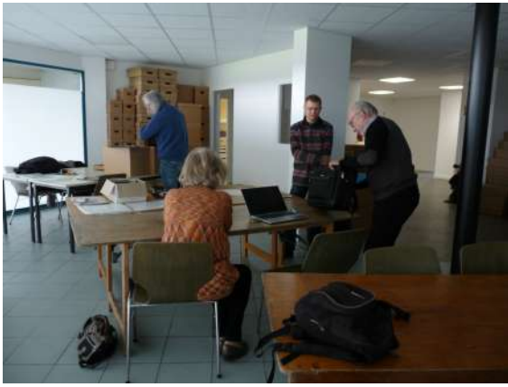
La préparation du travail