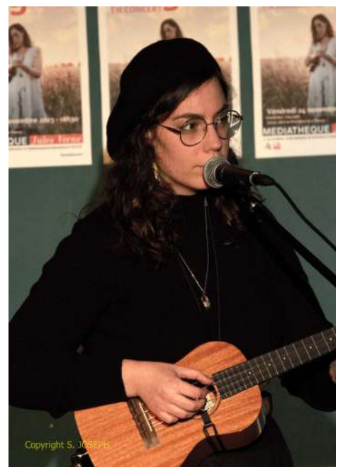
Hayel chanteuse de la région à la Médiathèque, vendr