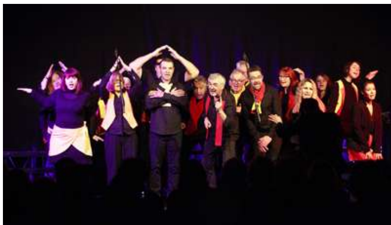
La chorale de dimanche, les Hurléloups